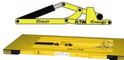
Reduzierte minimale Höhe (96 mm – an JOLLIFT 1330) durch das POWER FLTIM ENERGY Patent