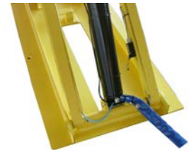
Stoppeinrichtung für endgültiges Senken mit akustischem Signal (in Kombination mit Radaufnahmeplatten)