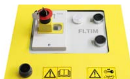
Notausknopf mit Schlüssel gegen unbefugte Benutzung