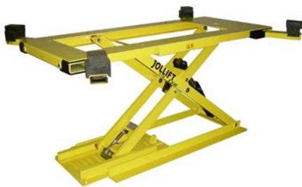
Standardheben mit Gummiauflagen und freien Rädern

Heben mit Gummiauflagen für freie Räder oder mit Rädern auf Platten