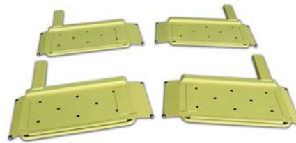
4P18 - Radaufnahmeplatten als Zubehör für alle Überflurmodelle. Das platzieren auf der Bühne wird schneller und die Karosseriestruktur verwindet sich nicht.