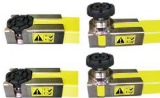
B90 Gummiauflagen bleiben auf den Hubarmen befestigt