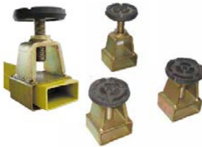
RUB Höhenverstellbare Gummiauflagen