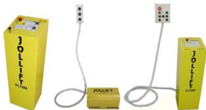
3 verschiedene Ansteuerungen: EH = elektrohydraulisch PH = pneumohydraulisch PE7 = pneumo-elektrohydraulisch