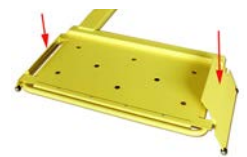
Abfallsicherungen vorne und hinten an den Radaufnahmeplatten