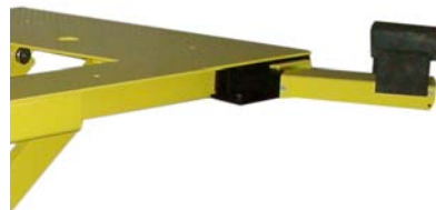
Die teleskopierbaren Aufnahmereime sind innerhalb der Stellfläche des Fahrzeuges, zur Sicherheit von Personen, die in der Nähe des Fahrzeuges arbeiten.