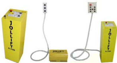
3 verschiedene Ansteuerungen: EH = elektrohydraulisch PH = pneumohydraulisch PE7 = pneumo-elektrohydraulisch